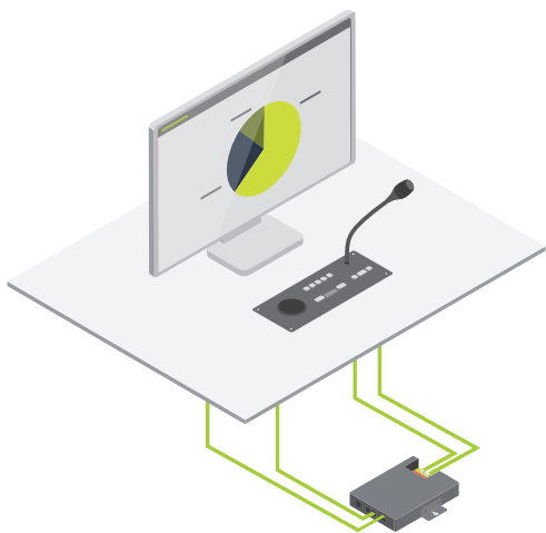
uniBOX-Setup mit einem Tischbildschirm und einer Einbaueinheit mit Confidea-Modulen Ihrer Wahl

Mit der uniBOX-Lösung von Televic können Sie nahezu jeden Bildschirm mit verschiedenen Confidea F-Modulen kombinieren, wie zum Beispiel einer Mikrofontaste, einer Abstimmungstafel, einem RFID-Ausweisleser und verschiedenen anderen Komponenten. Verbinden Sie die uniBOX mit einem Desktop-Bildschirm oder wählen Sie ein dezenteres Erscheinungsbild und kombinieren Sie die uniBOX mit einem motorbetriebenen Bildschirm, der im Tisch verschwindet.