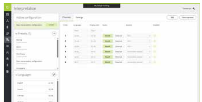
Voorbeeld van een Virtuele tolkconfiguratie in Confero

De integratie is eenvoudig en steunt op een standaard AV-infrastructuur. Het geluid van de tolken op afstand wordt via Dante rechtstreeks in het Plixus-systeem geleverd, samen met het geluid van de lokale tolkendesks. Terwijl de lokale tolkendesks inherent door het Plixus-systeem worden gestuurd, vindt de microfoonbediening voor de tolken op afstand plaats via API-integratie, wat mogelijk wordt zodra de licentie is geactiveerd. Deze aanpak zorgt ervoor dat de technische voetafdruk ter plaatse minimaal blijft, terwijl je de workflow van de simultaanvertaling volledig onder controle houdt – ongeacht of de tolken in de zaal zitten of op afstand werken.